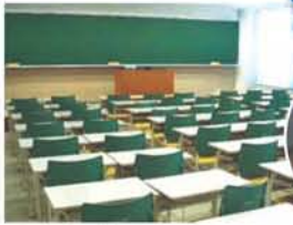
教室・机・椅子、広々とゆったりスペース