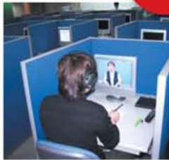
メディアエッジで個別学習。 (一部有料) 進学資料室・個別指導プ ースもあります。