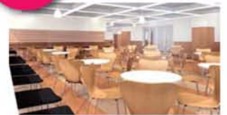
学習の合い間に6Fフロンティアホール でリラックス。 時には友人との語らいでリフレッシュ しよう!