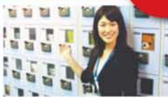
通学時間が片道1時間以上 かかる方、最優先で利用して いただいています。