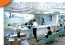
きれいで広くて明るい 校舎です。 笑顔でみなさんをお 迎えます。