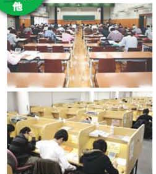
種類・座席ともに充実。その日の気分 で自習室を選ぼう!