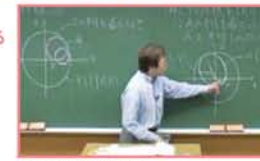
[臨場感あふれる画像]